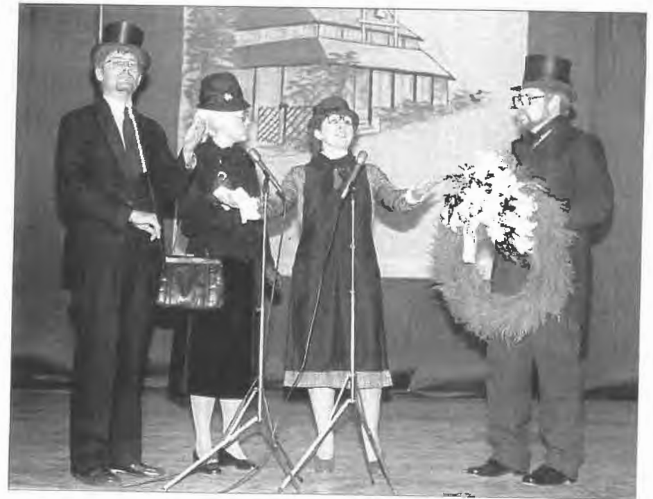
Während der Festlichkeiten zum 30jährigen Bestehen der Bethlehemkirche im März 1980 präsentierte sich diese muntere Truppe