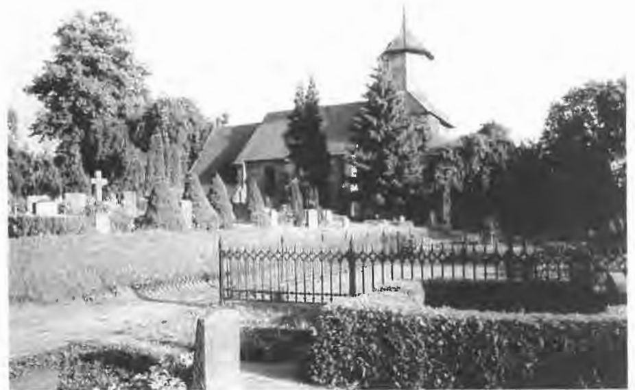
Die schöne mecklenburgische Dorfkirche in Kirch-Grambow, die nach ihrer aufwendigen Renovierung in neuem Glanz erstrahlt. Mit Kirch-Grambow besteht seit 1990 eine rege Partnerschaft.