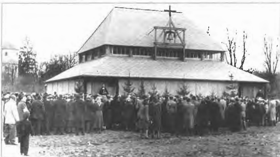
Der Einweihungsgottesdienst im Jahre 1950

An viele Gemeindeabende, Feste und Feiern erinnere ich mich gern, besonders auch an die stimmungsvollen Adventsfeiern in unserer Kirche.