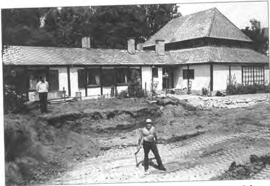
Wo nur eine Grube mit einem einsamen Bauarbeiter zu sehen ist, wird sich bald stolz das neue Gemeindehaus erheben