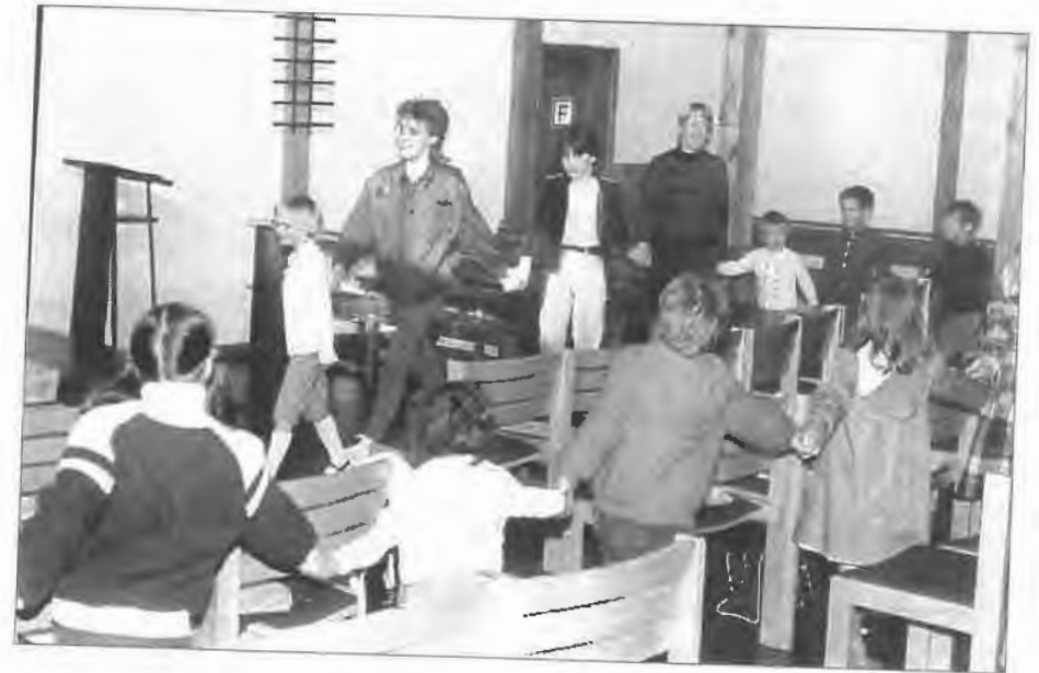
Kinderbibelwoche im Jahre 1984 in der Bethlehemkirche

Innergemeindlich war für mich die Zeit geprägt von Anstrengungen zu einer gewissen „Normalität“. Nachdem vorher die Geistlichen in Wertingen ständig gewechselt hatten, galt es anknüpfend an den Vorgänger, so etwas wie „normales“ kirchliches Leben zu schaffen.