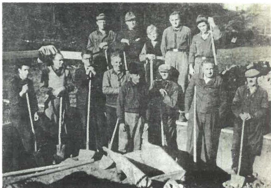
Aushubarbeiten für die Bethlehemkirche 1949