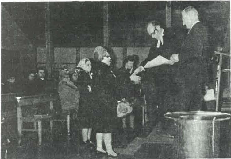
Helferehrung am Kirchweihstag 11. März 1973