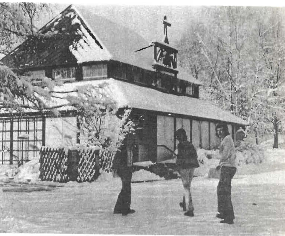
Die Bethlehemkirche im Februar 1975